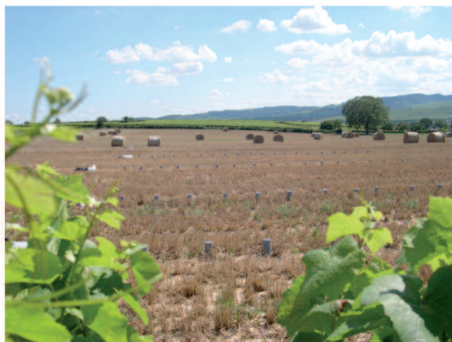
Photo 1 : vue du dispositif de collecte des embruns depuis la zone d'application.

En cultures pérennes, la principale difficulté pour la réalisation de ces expérimentations est de trouver des parcelles correspondant au cahier des charges (notamment l'absence de cultures sur la zone de collecte) puis de réunir l'ensemble des conditions favorables à la réalisation des essais : direction du vent par rapport à l'orientation des rangs sur les parcelles sélectionnées, vitesse du vent, sols ressuyés, disponibilité de 7 opérateurs au minimum.