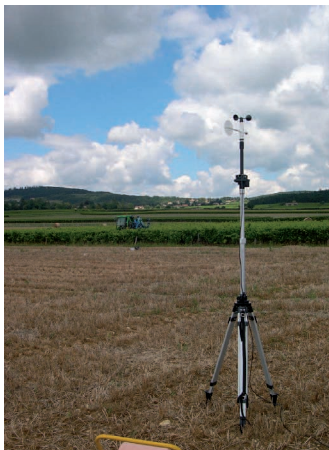
Photo 4 : enregistrement des données météorologiques lors des essais ; le vent doit être perpendiculaire à l'orientation des rangs de vigne.